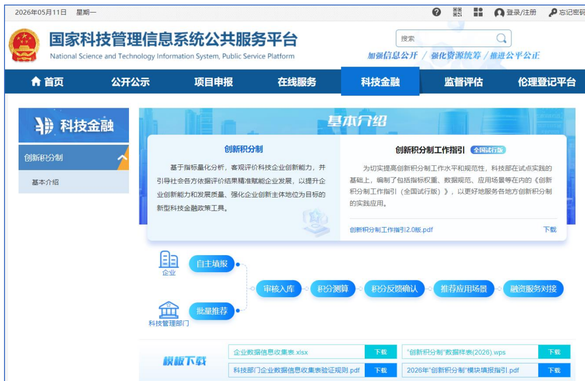
图3 “创新积分制”基本介绍

省、市、区（县）级科技主管部门和科技型企业用户可通过国科管系统（网址： https://service.most.gov.cn/ ）登录，点击“科技金融—创新积分制”查看“创新积分制”服务模块（图3）。