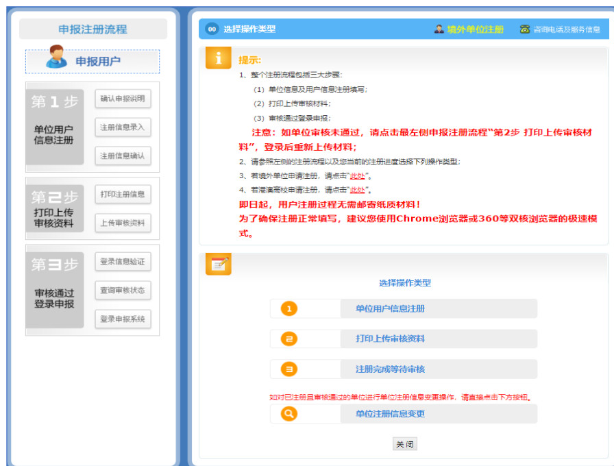
图 1 国科管系统账号注册流程

尚未注册账号的省、市、区（县）级科技主管部门业务人员，可联系本单位管理员申请创建业务账号。具体请本单位管理员登录国科管系统，点击“在线服务—用户信息管理—本单位用户管理”创建账号。