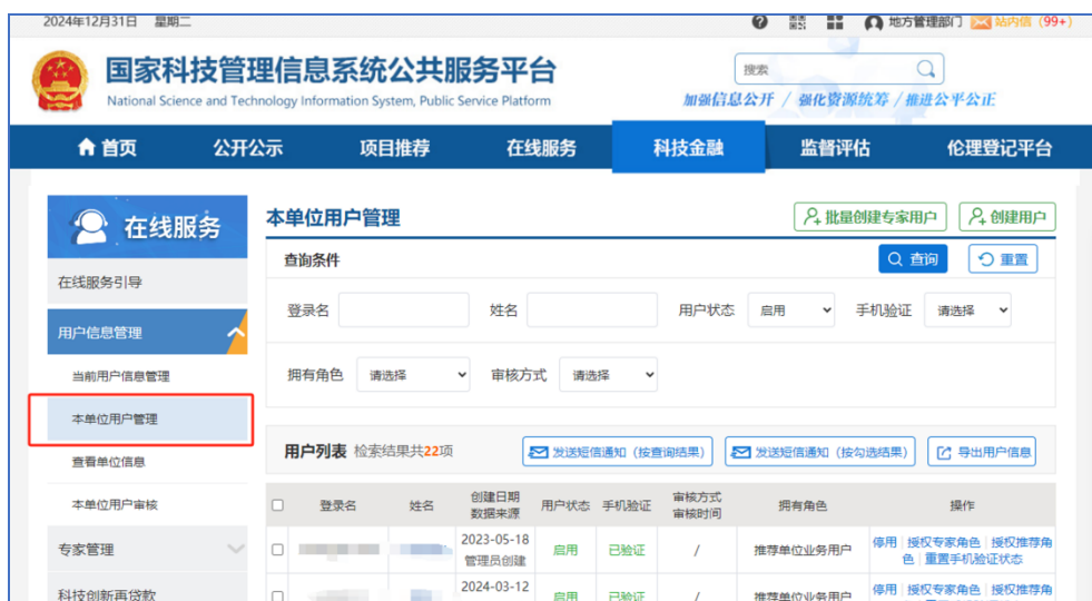
图 2 地方科技主管部门用户账号创建

尚未注册账号的省、市、区（县）级科技主管部门业务人员，可联系本单位管理员申请创建业务账号。具体请本单位管理员登录国科管系统，点击“在线服务—用户信息管理—本单位用户管理”创建账号。