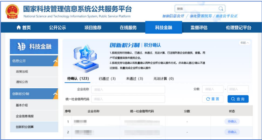
图 12 创新积分反馈确认

企业信息报送后，将对已报送入库的企业集中测算创新积分，省级科技主管部门用户可登录系统查看和下载企业创新积分，并对企业积分进行确认（图 12）。