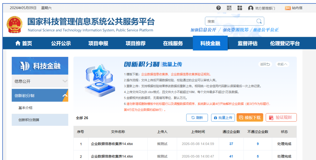
图 6 批量推荐

省、市、区（县）级科技主管部门用户点击“创新积分测算—批量上传”批量上传企业信息。校验通过的企业进入省级主管部门的审核环节，校验未通过的企业可以修改后重新上传（图 6）。