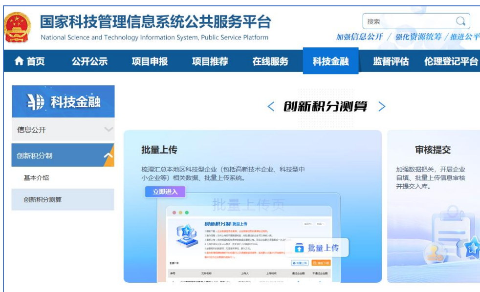
图 5 地方科技主管部门批量上传界面