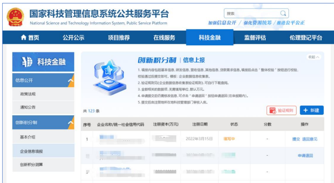
图4 科技型企业“自主填报”渠道

科技型企业可以通过“创新积分制—企业信息填报”模块开展本公司数据信息报送。请点击“新建”按钮进行填报（图4）。