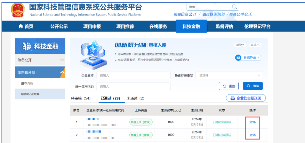
图 10 已通过列表

“待审核”列表展示企业自主填报和各级主管部门批量推荐的所有企业。当存在相同企业信息重复上传时，省级主管部门需审核并确认通过其中一条。所有审核通过企业信息进入“已通过”列表，如需退回重新审核可以点击“撤销”（图 10）。