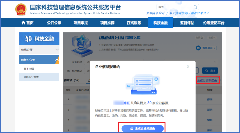
图 11 生成企业报送函

省级科技主管部门对处于“已通过待报送”状态的企业集中生成企业报送函（图 11），下载盖章后回传系统。